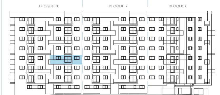
UBICACIÓN EN ALZADO