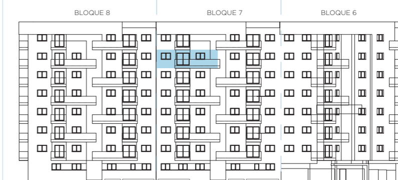
UBICACIÓN EN ALZADO